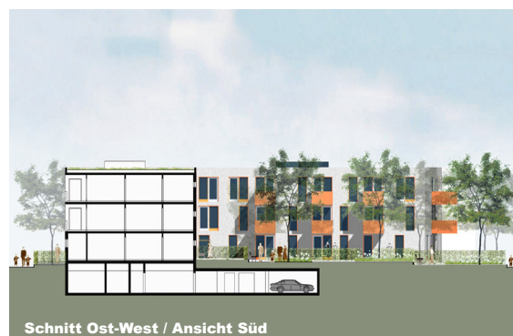
Schnitt Ost-West / Ansicht Süd