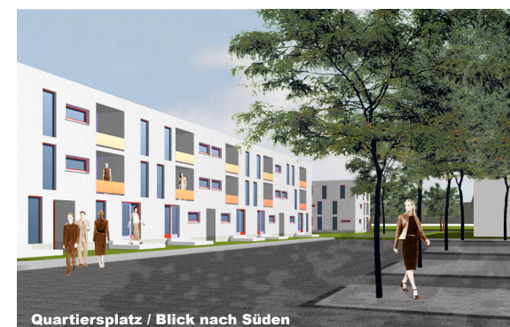
Quartiersplatz / Blick nach Süden