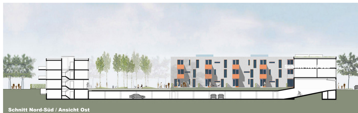
Schnitt Nord-Süd / Ansicht Ost