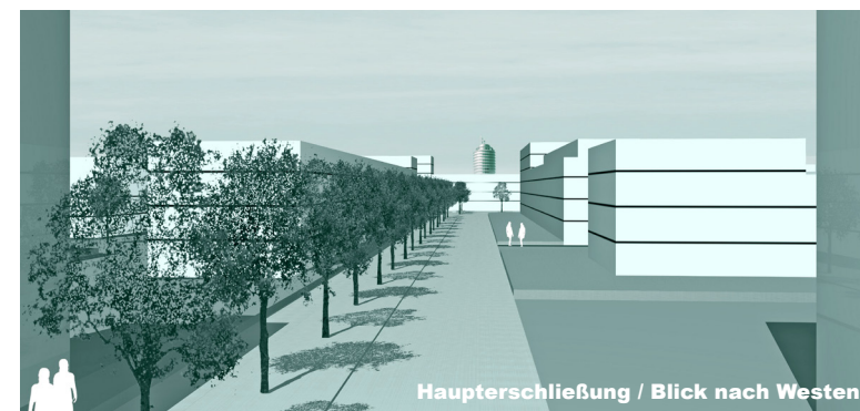
Haupteinschließung / Blick nach Westen

2008, Projekt von EISENLAUER VOITH, Projektleitung Peter Eisenlauer, mit Bürger Landschaftsarchitekten, München Auslöser LH München, vertreten durch Maßnahmeträger München-Riem GmbH (MRG)