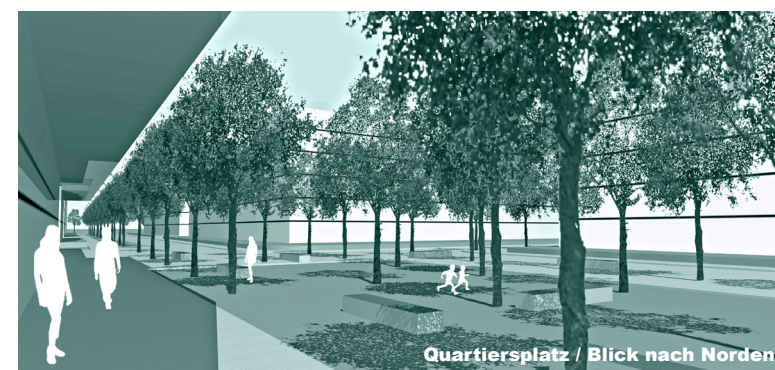
Quartiersplatz / Blick nach Norden